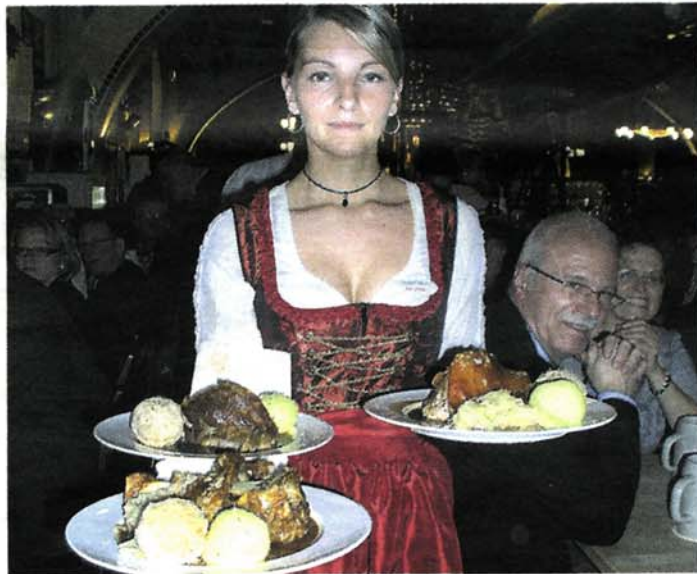
Da möchte man doch gleich einen Teller mit der Schweinshaxe haben.

Das historische Ambiente ist geschmackvoll ergänzt von einem wunderschönen Biergarten mitten im Park sowie dem überdachten Palmengarten im Jugendstil. Er ist sogar beheizt, so dass man wetterunabhängig auch bei etwas kühleren Temperaturen noch gemütlich tafeln kann.