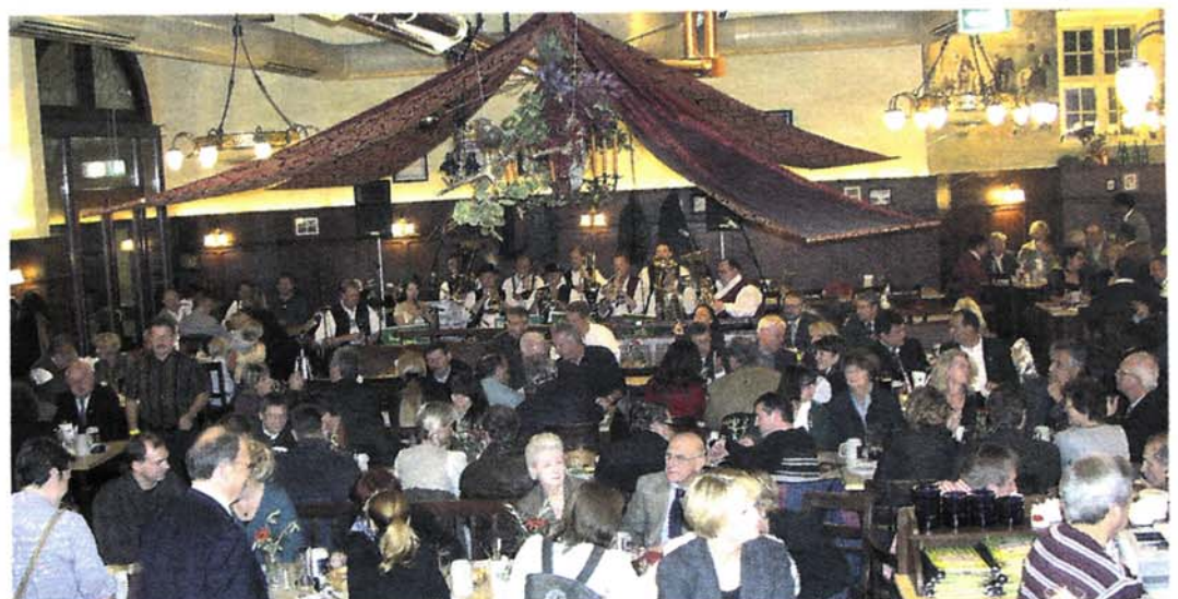
Nicht nur beim Bock-Anstich ist das Fürstliche Brauhaus ein gemütlicher Ort der zünftigen Begegnung.